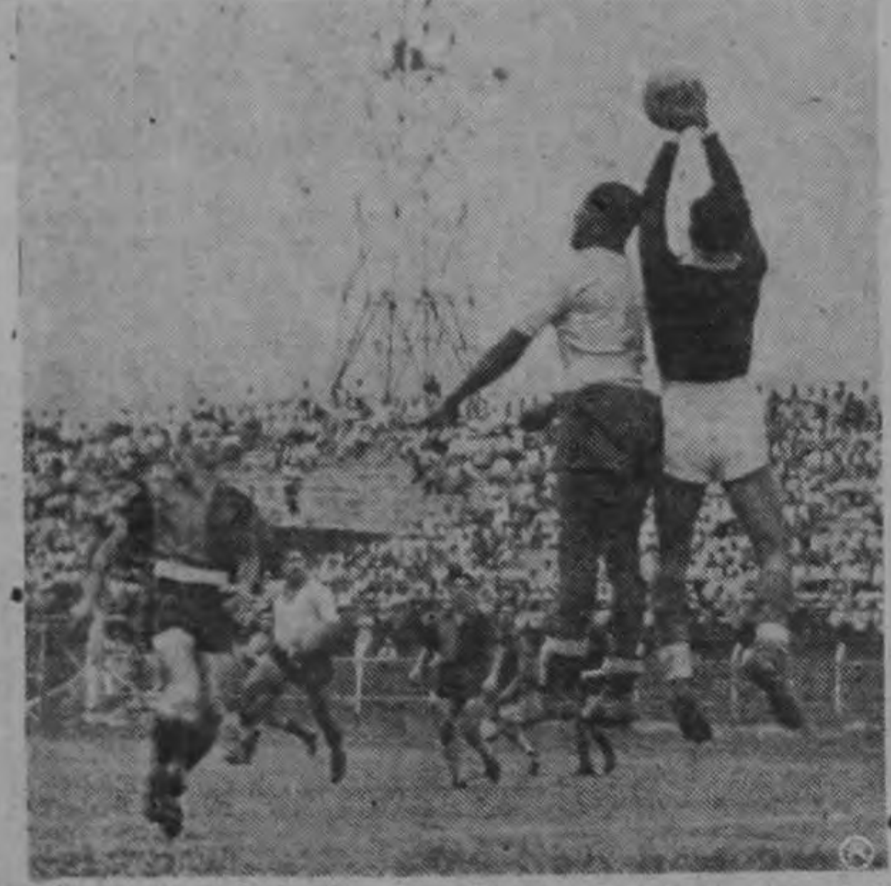
El acucioso Barbarillo va a disparar de cabeza, pero el Cholo Rodríguez le arrebató el balón evitando la anotación.