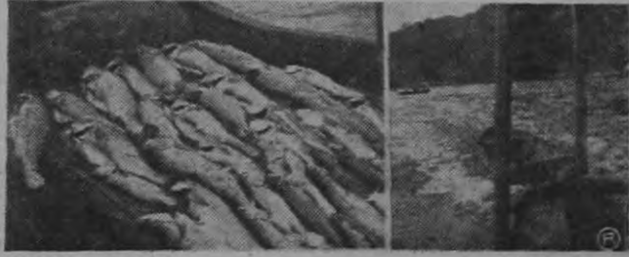
En la foto vemos el resultado de estas competencias acomodado sobre la cubierta de la lancha. Esperamos que para las próximas competencias la cubierta de la lancha sea de poca extensión.