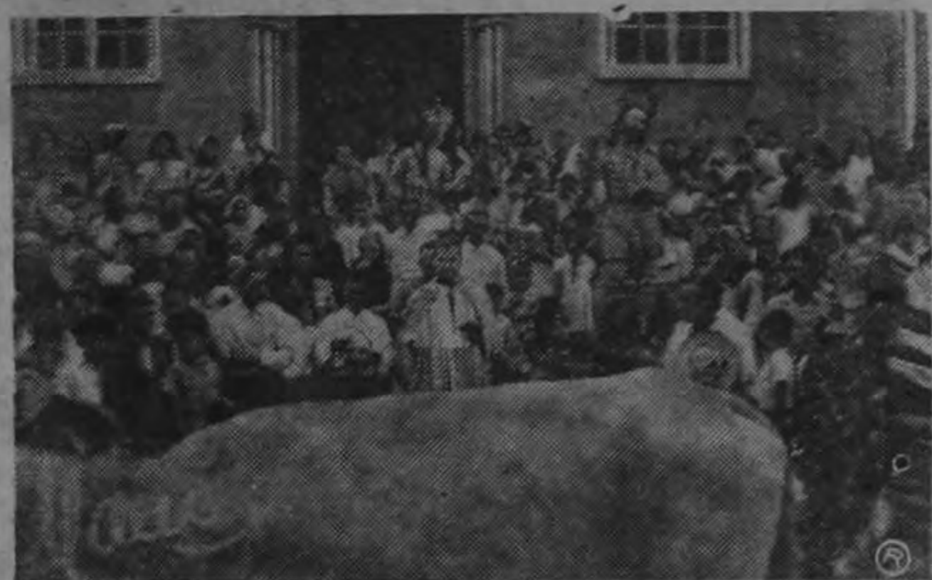
FIESTA EN GRECIA. —Muy lucidas estuvieron las actuaciones realizadas el domingo en Grecia con motivo de la inauguración del Estadio Colón y de la instalación y bendición del nuevo Liceo León Cortés, con asistencia del señor Presidente de la República, don Otilio Ulaté. 1) El Jefe del Estado descubriendo el retrato de León Cortés; 2) El Ministro de Obras Públicas entregando el Estadio; 3) Desfile del alumnado del Liceo; 4) Bendición de Carretas.

“Si don Mario Echandi quiere ser Diputado, que lo haga jugándose sus propios méritos y no tratando de cobijarse bajo la bandera del plebiscito”