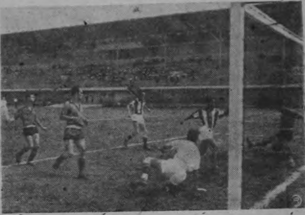
La Libertad anota su empate frente al Alajuelense, en el match preliminar de terceras divisiones del domingo.