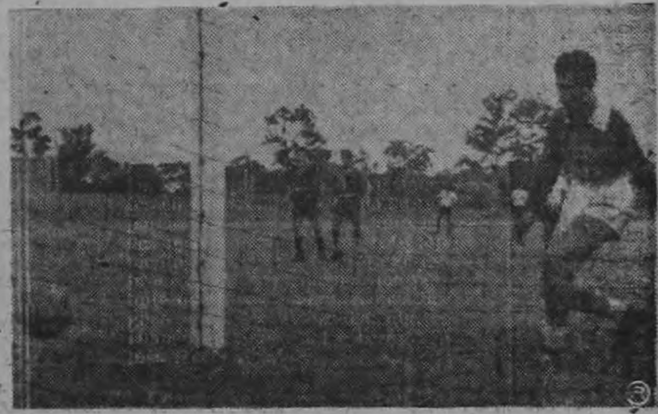
Al castigarse el penalty, el Cholo Rodríguez no puede interceptar y la pelota entra con fuerza.