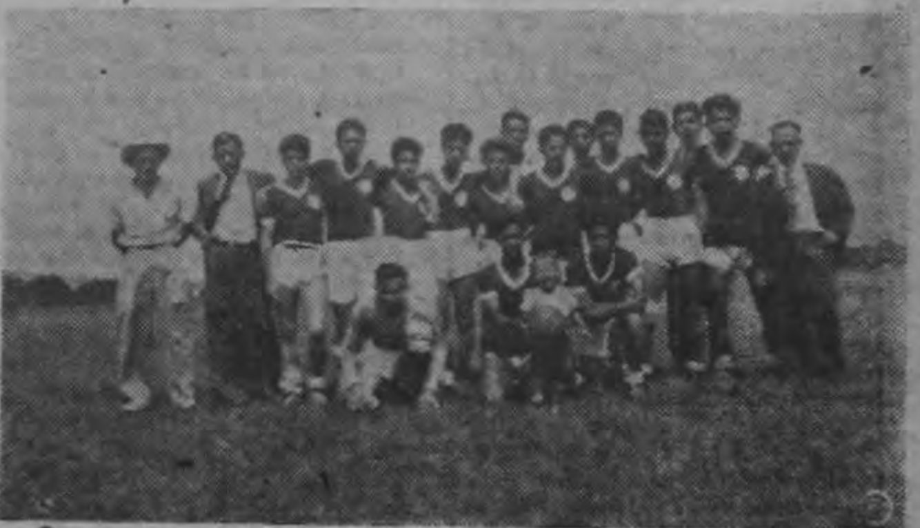
Jugadores que integraron el primer equipo del Nicolás Marín.

niles, infantiles y mosquitos. Su nombre se ha extendido por todo el país donde ha actuado con resultados satisfactorios para el conjunto. Todas sus divisiones participan en los campeonatos de sus respectivas categorías.