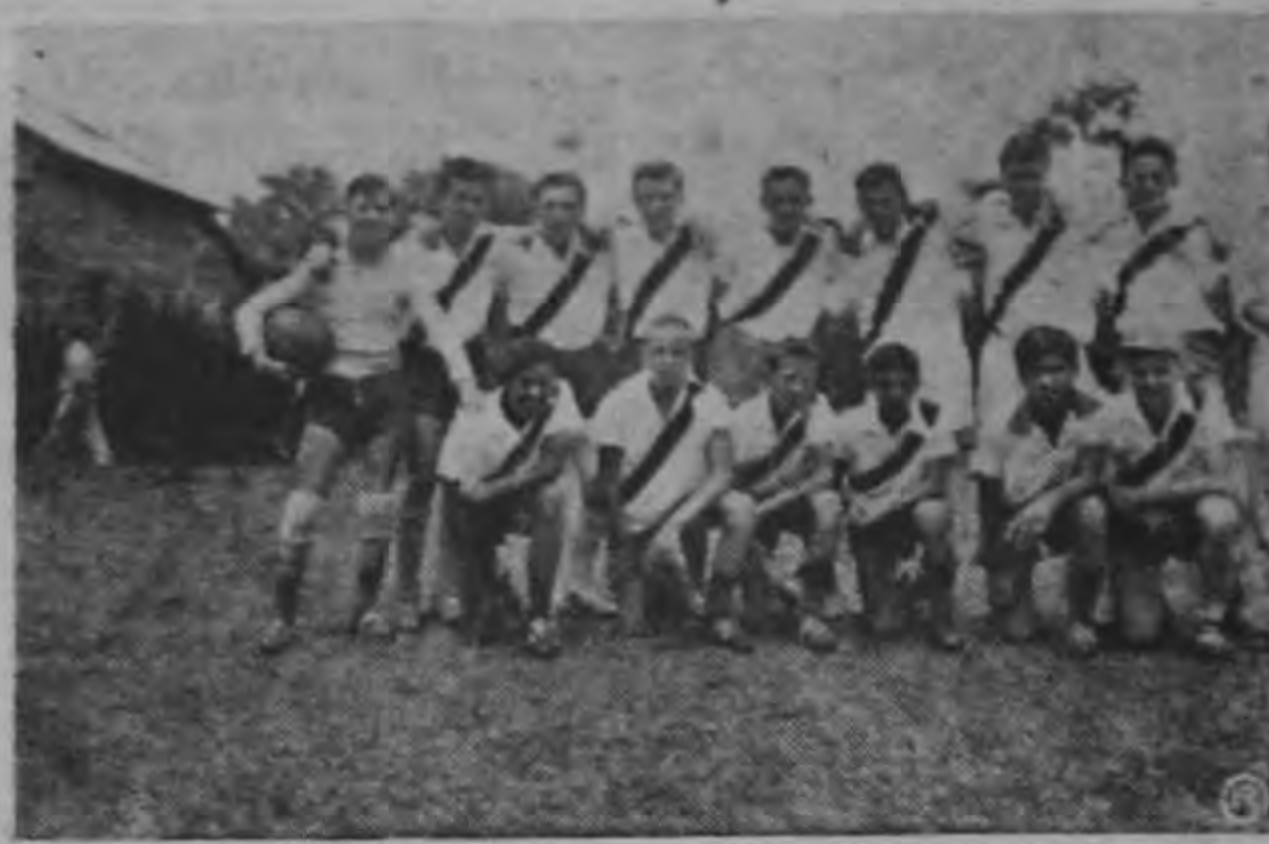
Equipo Juvenil del Nicolás Marín