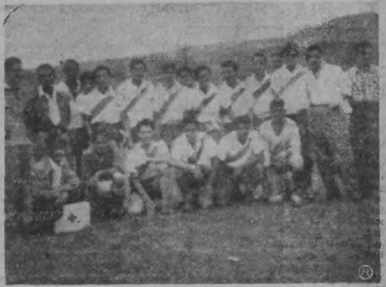
Segunda división del Nicolás Marín

Pese a los pocos años que lleva de organizado está inscrito en el Registro de Sociedades y tiene cinco años de estar federado. Cuenta también con cinco equipos catalogados en la forma siguiente: Primera, segunda, tercera, juve-