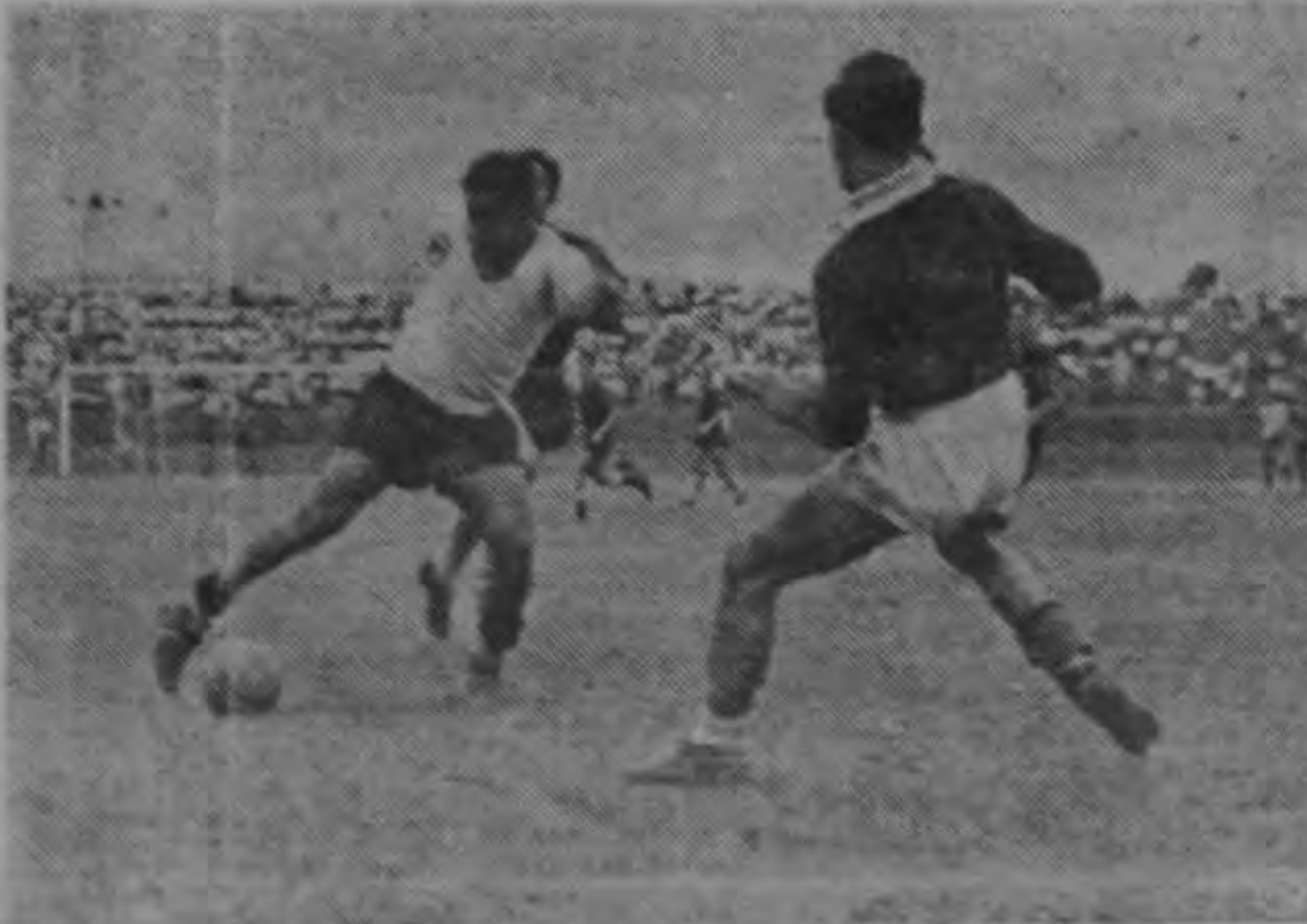
Alajuelenses y peruanos en reñida lucha por obtener goles.

Tres goles anotaron los peruanos por uno de la Liga. No fué un juego de Sport Boys más trabajadores dentro del field y mejor coordinación en sus te compromiso internacional, muy deficientes, no mostrándose un cuadro