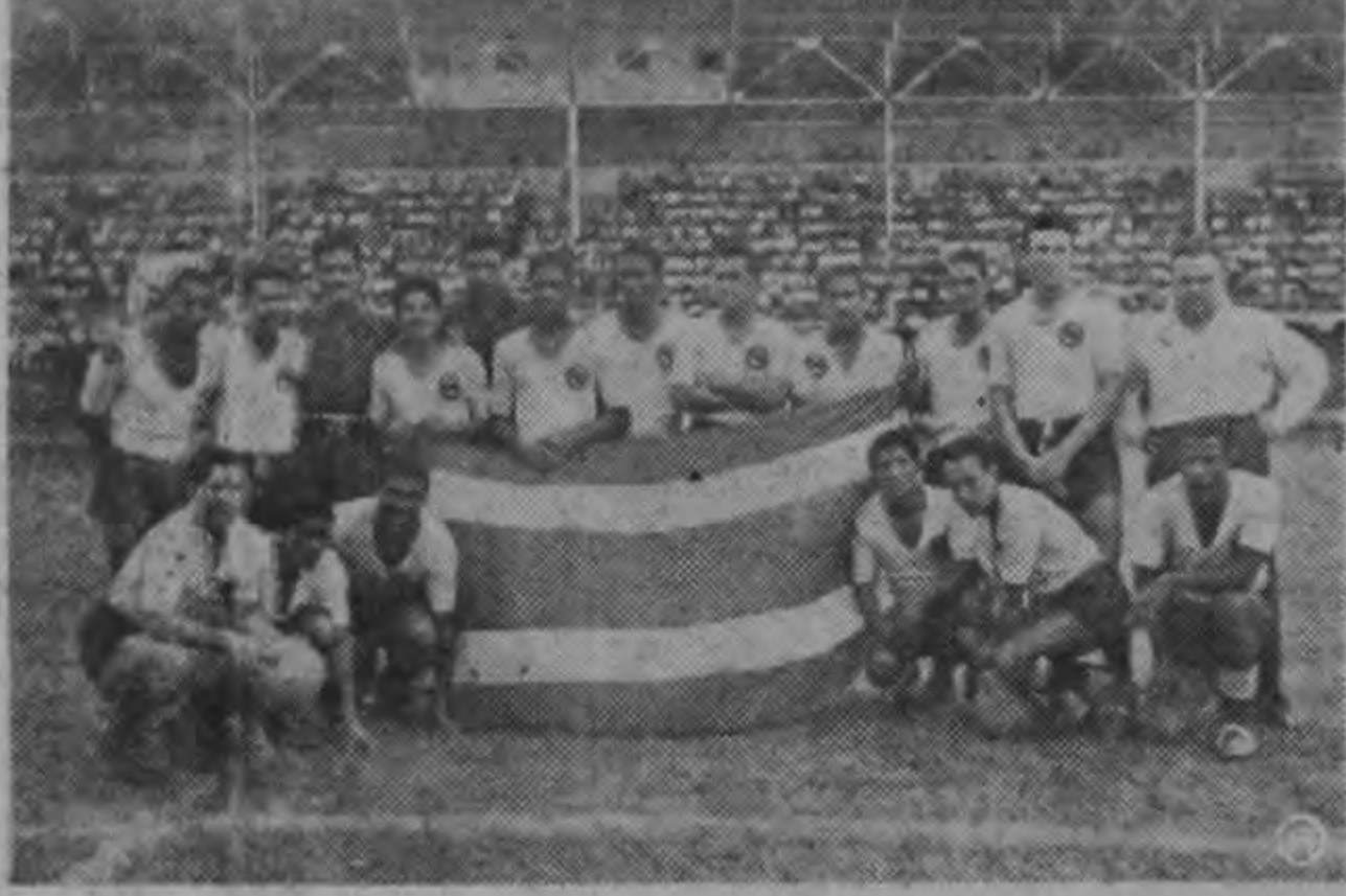
El equipo Sport Boys del Perú posan para AIRELIBRE.