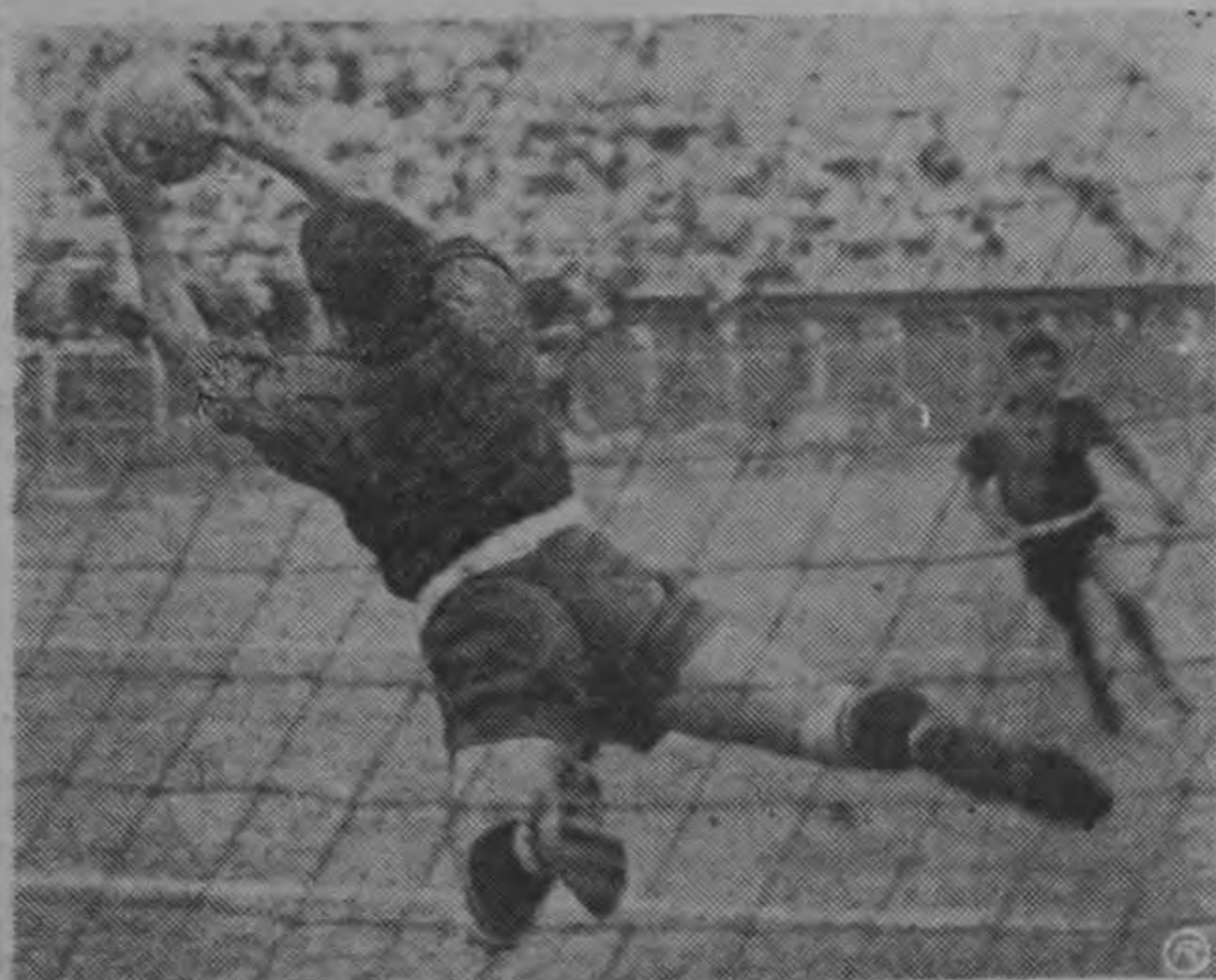
El guardameta Velázquez en formidable intervención

—Se anuncia con lujo de detalles que en El Salvador se jugará una cuadrangular de fútbol con la participación de Palermo y Co-